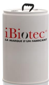
Tonnelet 25 L