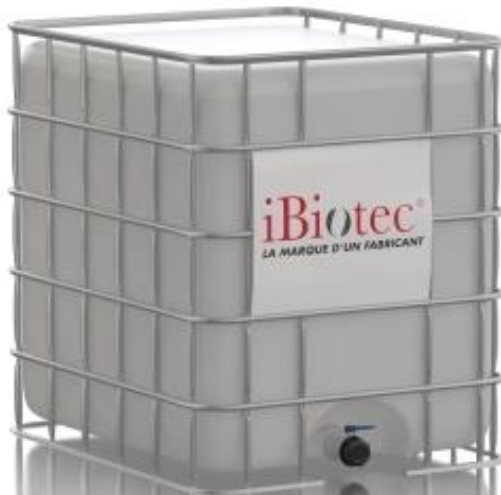
Container GRV 1000 L

iBiotec® Tec Industries® Service Z.I La Massane - 13210 Saint-Rémy de Provence – France Tél. +33(0)4 90 92 74 70 – Fax. +33 (0)4 90 92 32 32 www.ibiotec.fr